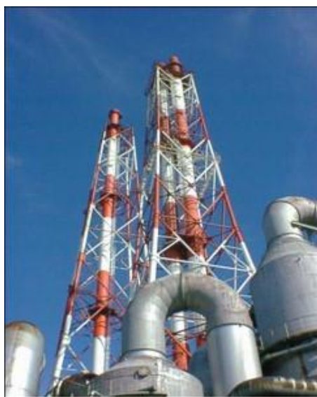
[三井化学大阪工場の大規模ボイラープラント]

日本電気株式会社(以下 NEC)、国立研究開発法人 産業技術総合研究所(以下 産総研)、三井化学株式会社(以下 三井化学)、株式会社オメガシミュレーション(以下 オメガシミュレーション)は、化学プラントなどの大規模インフラの運転を支援する「プラント運転支援 AI」とシミュレータ上に再現したミラープラントを組み合わせたプラント運転支援システムを構築し、三井化学大阪工場の大規模ボイラープラントにおけるスタートアップ操作の支援に成功しました。